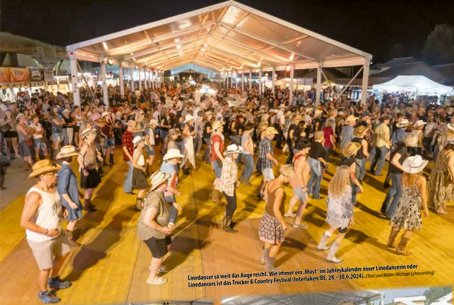
Linedancer so weit das Auge reicht. Wie immer ein „Must“ im Jahreskalender einer Linedancerin oder Linedancers ist das Trucker & Country Festival (Interlaken/BE, 28.–30.6.2024).