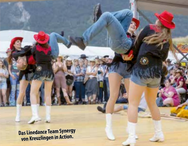
Das Linedance Team Synergy von Kreuzlingen in Action.