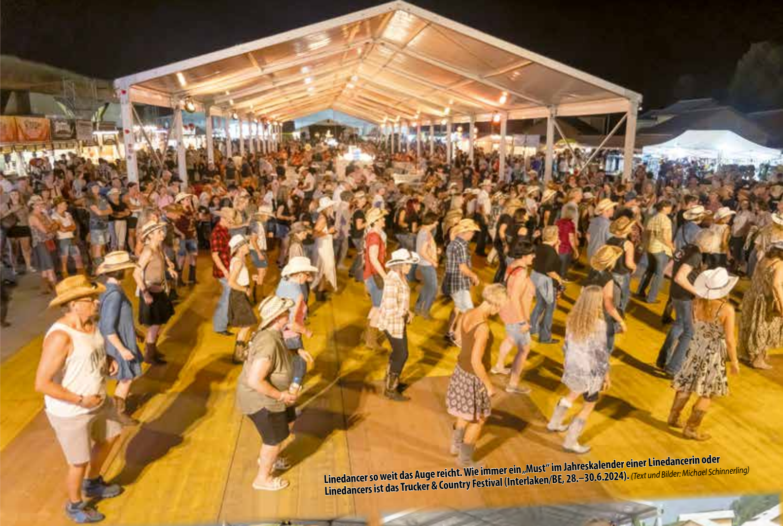
Linedancer so weit das Auge reicht. Wie immer ein „Must“ im Jahreskalender einer Linedancerin oder Linedancers ist das Trucker & Country Festival (Interlaken/BE, 28.–30.6.2024).