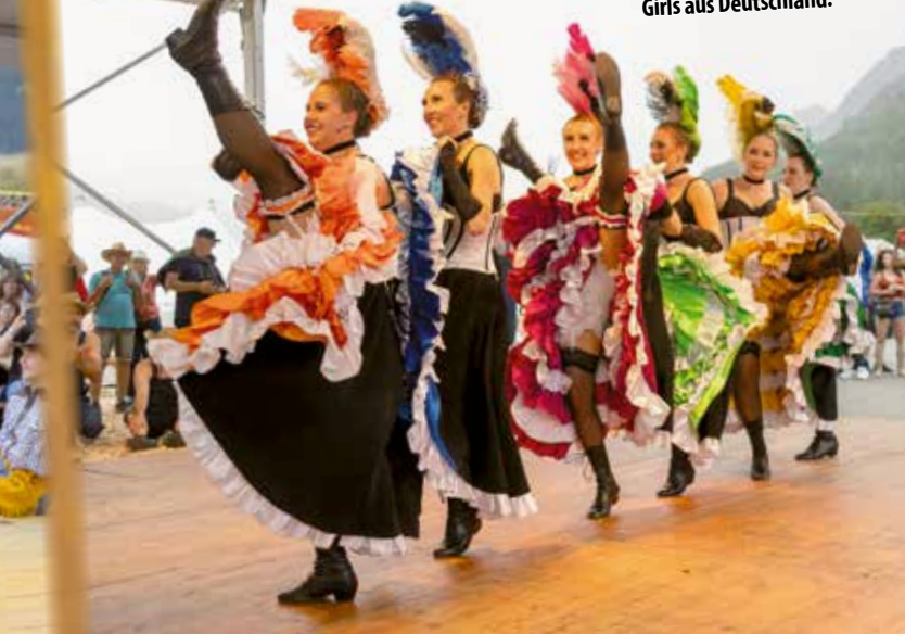
Cancan-Show der Wild West Girls aus Deutschland.